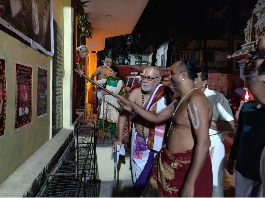
@ Bengaluru, during First Public Screening of the movie Sri Vedanta Desika's Ghantavatharam on 31-Dec-2019

श्रिमन्नारयणार्यः गुरुवरमनघः सर्वशास्त्रार्थ वेत्ता ख्यात श्रीरङ्गकारीट् प्रभव यतिपतेः प्राप्तमुद्राञ्च विष्णुः । वेदान्ताचार्यनाम्ना यतिपतिकमलेन्यस्त सर्वात्मभारः जीयात् रामायणार्यः बहुजनकमलोद्भास मार्ताण्ड तेजः ॥